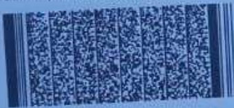
Timbre electrónico SRCel

Verifique documento en www.registrocivil.gob.cl o a nuestro Call Center 600 370 2000, para teléfonos fijos y celulares. La próxima vez, obtén este certificado en www.registrocivil.gob.cl .